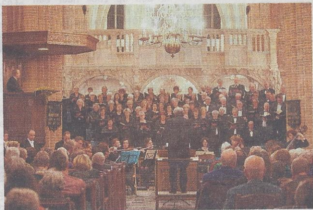
Euphonia tijdens het concert ter gelegenheid van haar 75-ste verjaardag